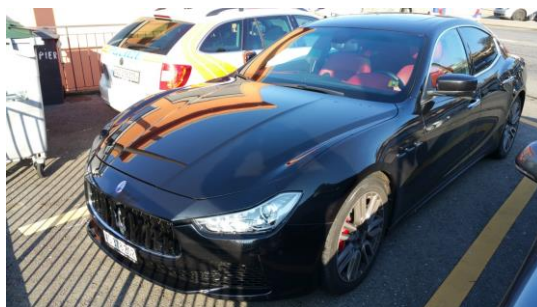
Conducteur en infraction, véhicule laissé plus de 10 jours sous notre responsabilité.

2.1.3. Dans leur activité quotidienne, nos collaborateurs conduisent différentes actions de police qui les obligent à saisir des véhicules automobiles, parfois de grande valeur, notamment dans le cadre de l'ivresse au volant, conduite sous l'emprise de produits illicites, retrait de permis à la suite d'une vitesse largement excessive, saisie de véhicule impliqué dans des affaires pénales et sur ordre du procureur. Dans ces situations particulières, l'organisation ne dispose d'aucune fourrière idoine permettant de garantir la sécurité des biens saisis à titre provisoire ou définitif. L'expérience quotidienne démontre que les entreprises spécialisées, garage ou carrosserie, ne veulent pas garder chez elles ces véhicules.