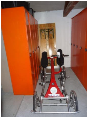
Véhicule volé ou abandonné