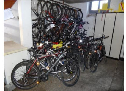
Vélos volés ou abandonnés