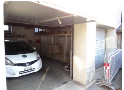
Garage à véhicule