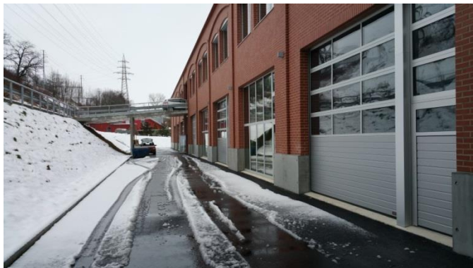
Site de Puidoux-Gare

Nous avons conduit une inspection locale sur le secteur considéré et constaté que le positionnement et la surface à louer répondaient parfaitement à notre attente. En accord avec le Comité de direction, nous avons demandé une offre aux propriétaires ; celle-ci est développée ci-dessous.